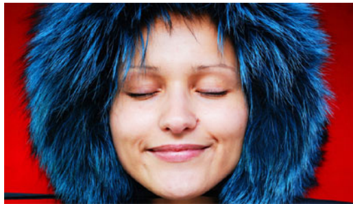
1-7 ottobre- 2010. Spazio "Via Ludovico il Moro 9"